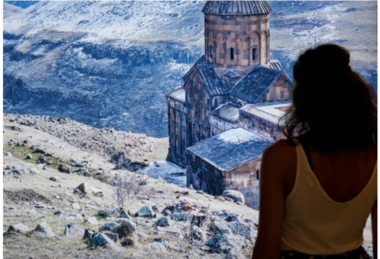
Պատկեր 2. Անիի մասին պատմող ցուցահանդեսը Հայաստանի ճարտարապետության թանգարանում

վերաբերյալ: Հայաստանի և Թուրքիայի մասնագետները պատմության մեջ առաջին անգամ միասին գնահատեցին Անիի հուշարձանների պահպանման հնարավորությունները և մշակեցին դրանց քայքայման մակարդակի գնահատման և արագ արձագանքի համատեղ մեթոդաբանություն 9 :