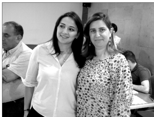
... գեղեցկացնում ՀՀՄ ֆոտոալբոմը: