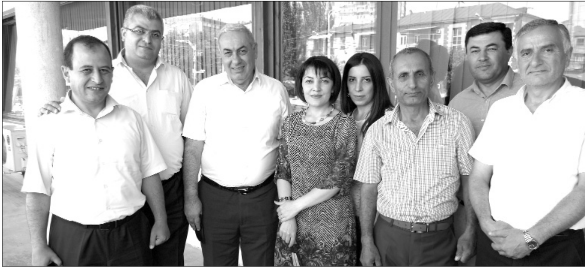
Հայաստանի տարբեր մարզերից ժամանած ՀՖՄ անդամները համաժողովից առաջ հասցրին շփվել եւ գրուցել պատշգամբում....