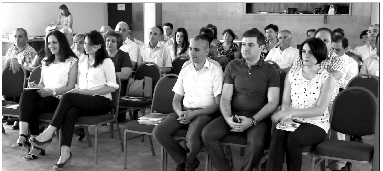
Նշանակված ժամին քվորումն էլ ապահովված է: