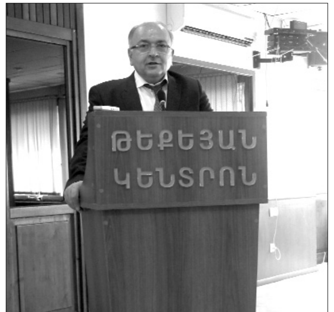
ՀՀ Տարածքային կառավարման եւ զարգացման առաջին փոխնախարար Վաչե Տերտերյան. «ՀՖՄ-ն շահեկանորեն բնութագրվում է իր համաչափ ու պրոֆեսիոնալ աշխատանքով»: