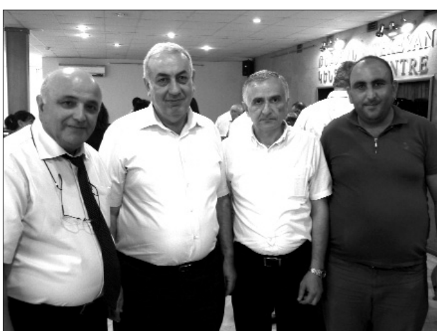
... լուսանկարվում ...