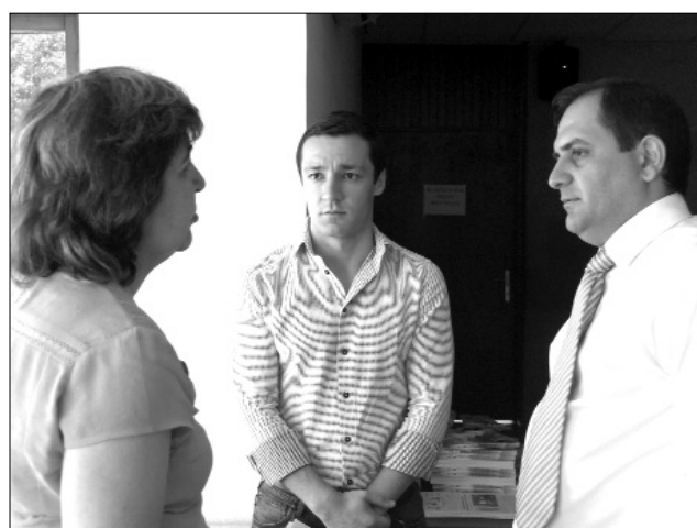
... պատմում իրենց հոգսերից ...