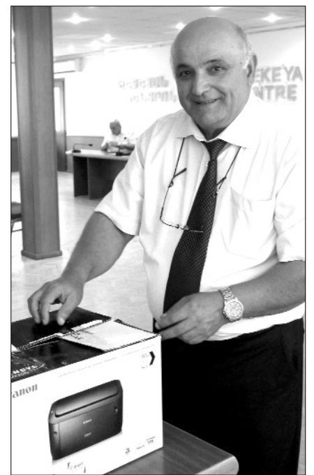
ՀՀՄ Նախագահ Վահան Մովսիսյանը ըվերարկության ժամանակ: