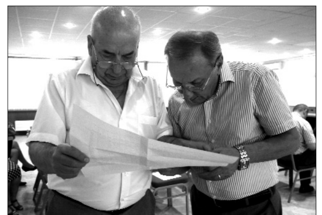
... փաստաթղթեր ուսումնասիրում...