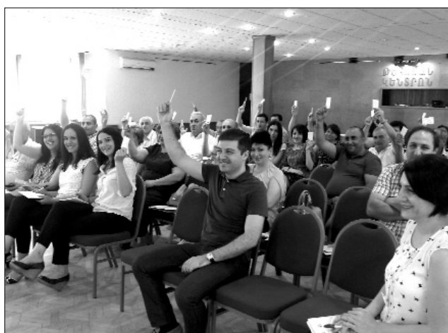
Հարցի քվեարկությունն անցավ միաձայն: