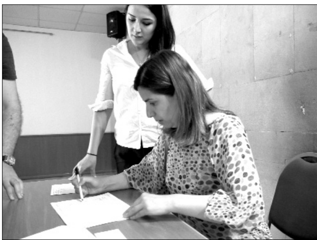
Համաժողովի մասնակիցները գրանցվում են: