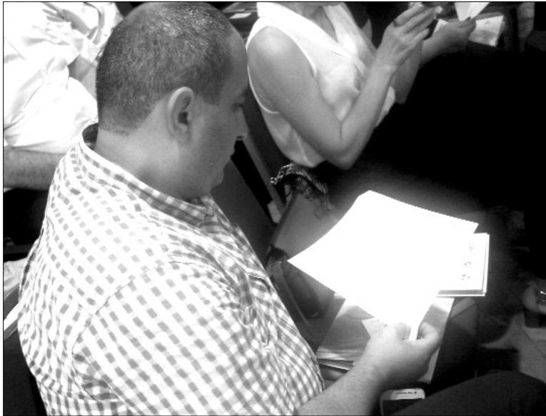
Համաժողովի մասնակիցները ծանոթանում են վերստուգիչ հանձնաժողովի հաշվետվությանը: