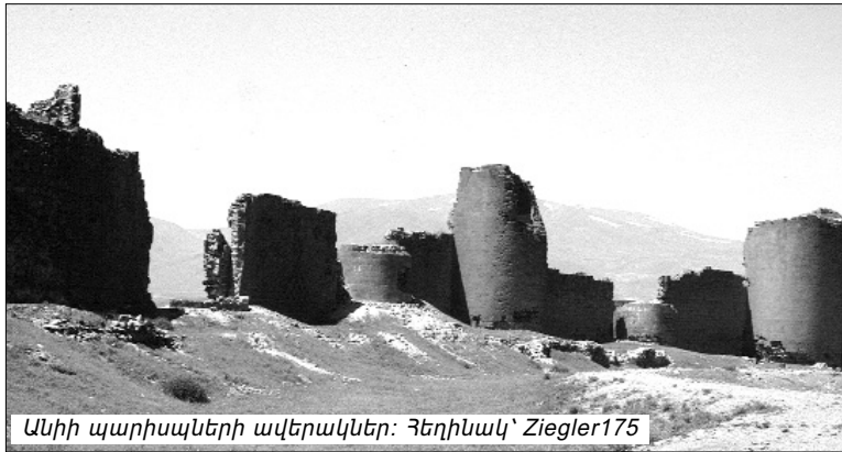
Անիի պարիսպների ավերակներ: Հեղինակ՝ Ziegler175

Ըստ «Պանկուից մեր օրերը» գրքի Հատվածները տպագրվում են հեղինակի համաձայնությամբ: