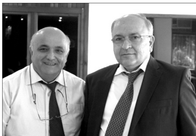
Փոխնախարար Վաչե Տերտերյան. «Ձեզանից շատերի հետ գործնական հարթությունում մեր հարաբերությունները երկար տարիների պատմություն ունեն»: