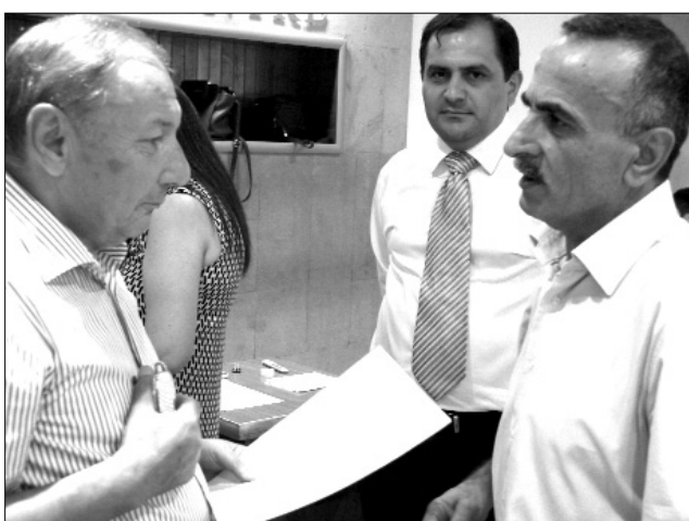
Մինչ հաշվիչ հանձնաժողովի իր գործն է անում, ՀՀՄ անդամները քննարկում են ...