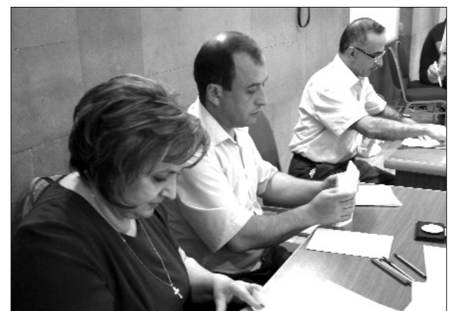
Հաշվիչ հանձնաժողովն ավարտում է լարված աշխատանքը: